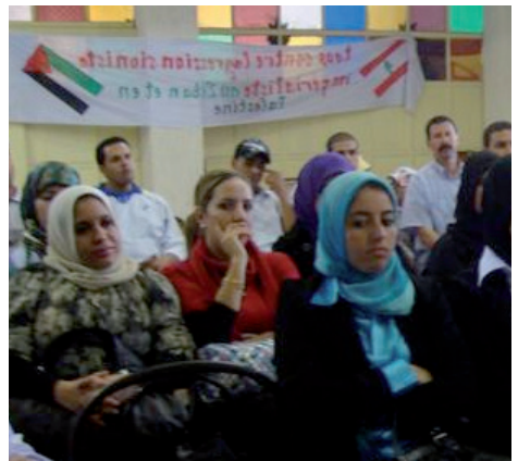
Rencontre internationale de travailleuses (Tanger, du 10 au 15 Février 2011)